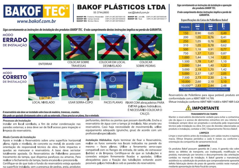
Figura 02. Manual de Instalação Bakof Tec*.