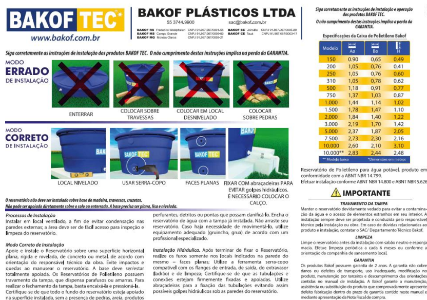
Figura 02. Manual de Instalação Bakof Tec*.